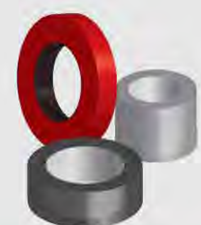
Gummiprodukte für die Textilindustrie