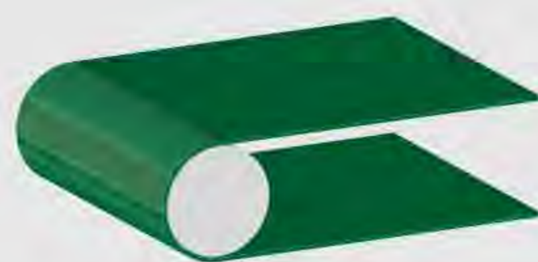
Transport- und Prozessbänder