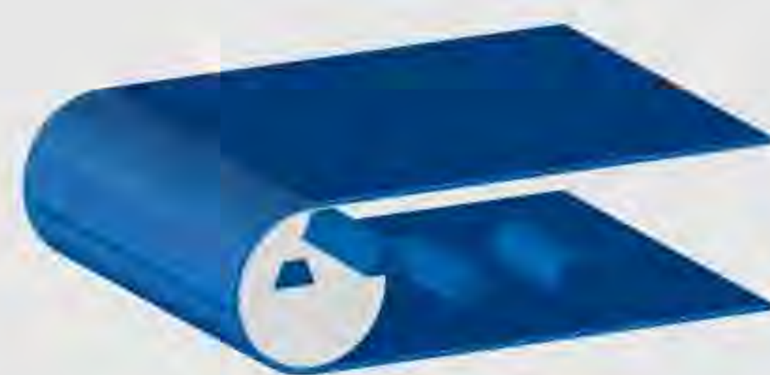
Kompakte und form-schlüssige Transport- und Prozessbänder