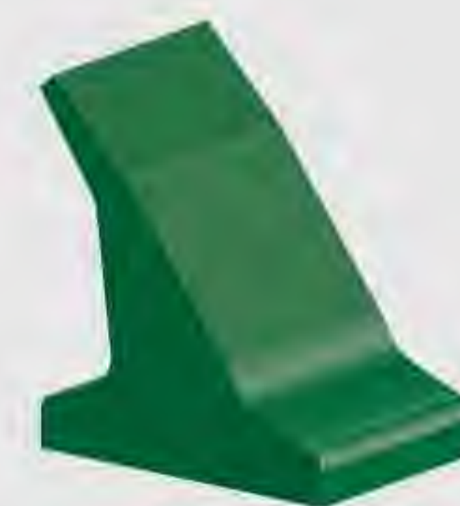
Längs- und Querprofile, Wellkanten