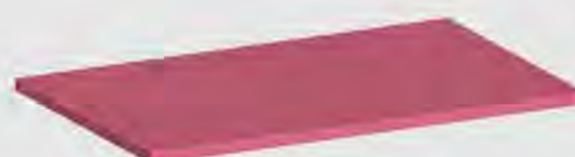
Elastomer- und Silikonplatten